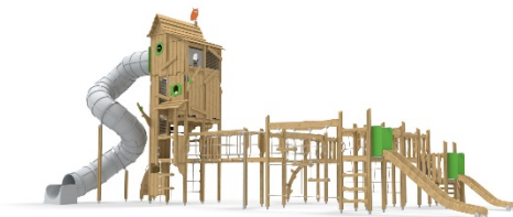
QFL0047; L 134cm W1032 cm H684 CM