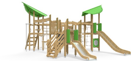
QFL0032; L 484cm W765 cm H381 CM