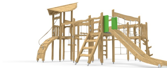
QFL0039; L 701cm W605 cm H382 CM